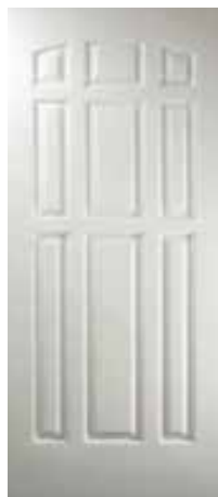
CLÁSICA 9 PANELES BLANCA