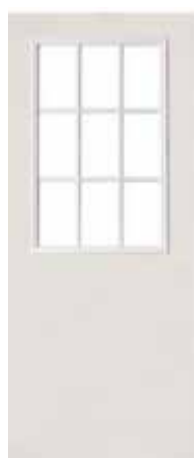
LISA 9 LUCES BLANCA