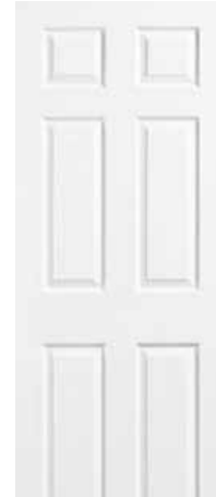
ALPINA 6 PANELES BLANCA

SE MANEJAN EN LAS SIGUIENTES MEDIDAS (CM):