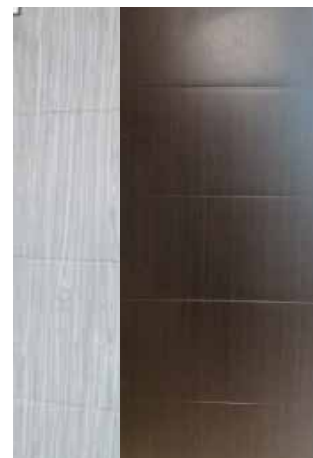
VETEADA CHOCOLATE Y GRIS

EN LAS PUERTAS LISAS Y VETEADAS SE MANEJAN LAS SIGUIENTES MEDIDAS (CM):