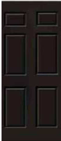
ALPINA 6 PANELES CHOCOLATE