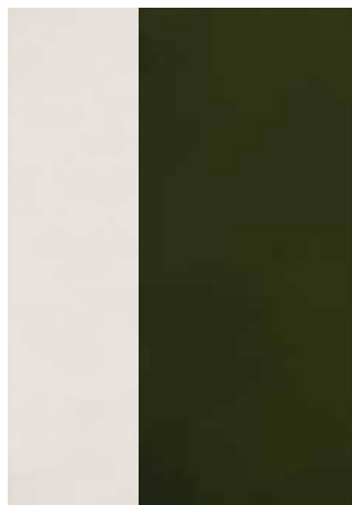
LISA BLANCA Y CHOCOLATE