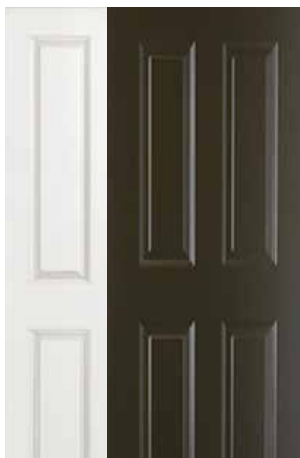
MIXTA 4 PANELES BLANCA Y CHOCOLATE