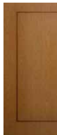
FORMA EN C CAOBILLA

SE MANEJAN EN LAS SIGUIENTES MEDIDAS (CM):