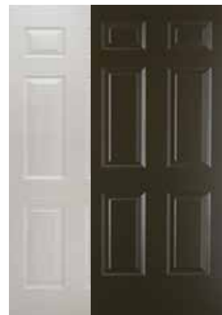
CLÁSICA 6 PANELES BLANCA Y CHOCOLATE