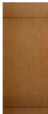
DOS RAYAS HORIZONTALES CAOBILLA