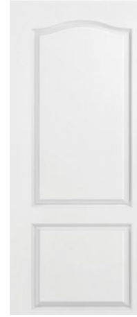
CALIFORNIA 2 PANELES BLANCA