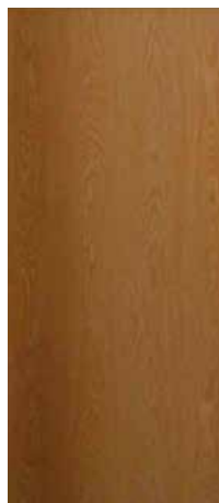
CAOBILLA 6 mm CAOBILLA