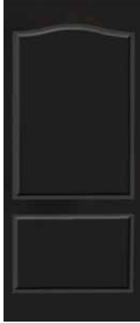
CALIFORNIA 2 PANELES CHOCOLATE