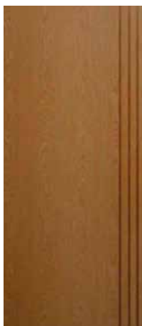
TRIPLE RAYA HORIZONTAL CAOBILLA