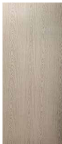
EUCAPLAC ROBLE GRIS

SE MANEJAN EN LAS SIGUIENTES MEDIDAS (CM):