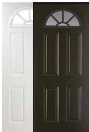
CLÁSICA MEDIA LUNA 4 PANELES BLANCA Y CHOCOLATE