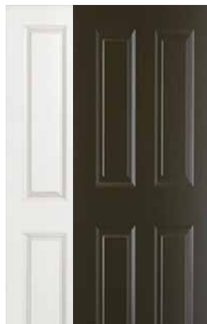
CLÁSICA 4 PANELES BLANCA Y CHOCOLATE